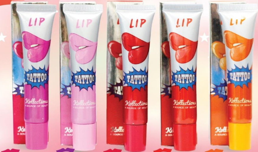
1 Pink Blossom